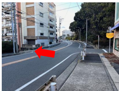
八事方面からの場合