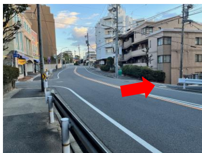
石川橋方面からの場合