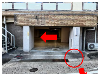
※赤丸箇所、段差がある のでお気をつけください